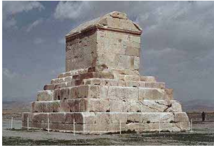
آرامگاه کوروش بزرگ