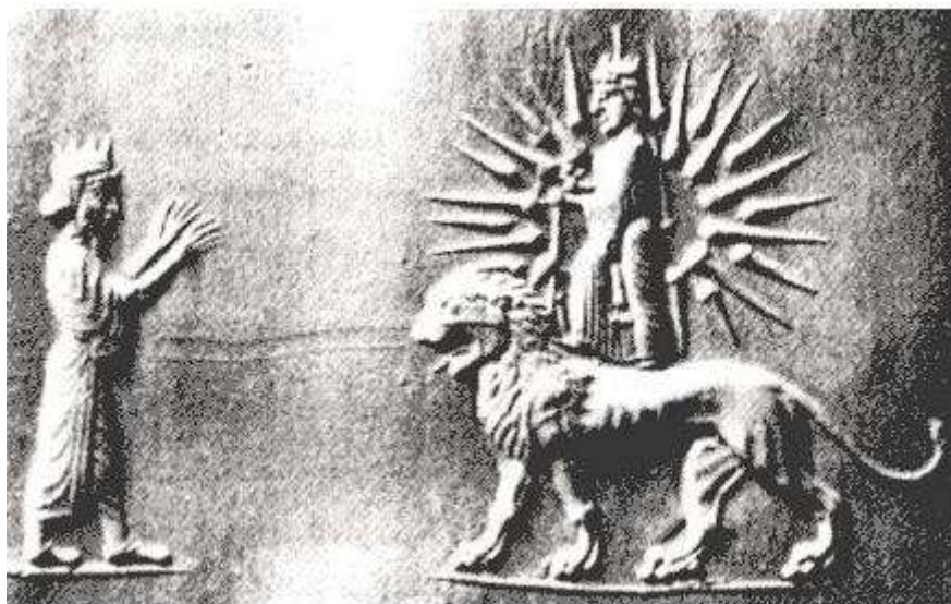
جواد مفرد کهلان

برگه ي ارزشمندی که از سده ي چهارم پیش از زایش مسیح (2400 سال پیش) و در موزه ي آرمنیاژ لنین گراد (سن پترزبورگ) نگهداری می شود و پادشاهی هخامنشی را در حضور ایزد مهر شیر سوار نشان میدهد.