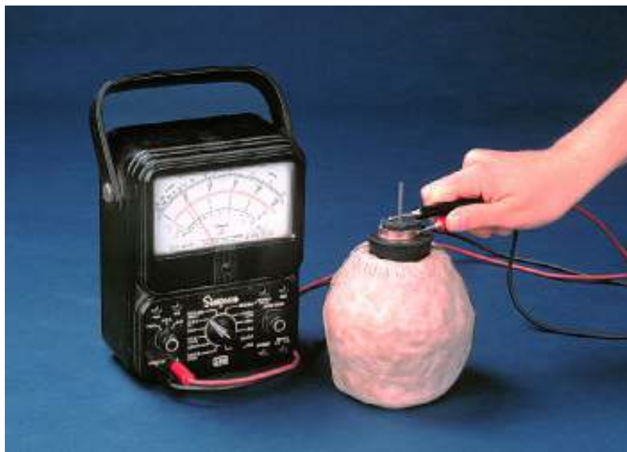
نمونه بازسازی شده باتری پارتی

جنگ جهانی دوم از ادامه ی پژوهش ها روی باتری های ایرانی جلوگیری کرد، مام پس از آن که ویران سازی فروکش کرد و آبادانی بار دیگر رونق گرفت، ویلارد گری (Willard F. M. Gray) از آزمایشگاه ولتاژ بالای شرکت جنرال الکتریک در ماساچوست، چند نمونه از این باتری ها ساخت. زمانی که آنها را با الکترولیتی مانند شیره ی انگور (سرکه) پر کرد، آن دستگاه ها حدود 2 ولت برق تولید کردند. این آزمایش بر شگفتی پژوهشگران و باستان شناسان افزود؛ چرا که دستگاهی پس از 2 هزار سال هنوز کار میکند.