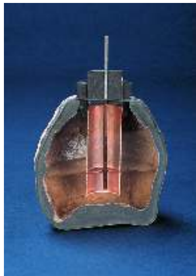
طرحی از ساختمان باتری پارتی

انتشار مقاله ی کونینگ در سال ۱۹۴۰، شگفتی باستان شناسان و جهانیان را برانگیخت و ایرانیان پس از دودها و حدود ۴۰ سال پیش برای نخستین بار از این دستاورد تمدنی خود آگاه شدند. به زودی آن را به فراموشی سپردند و در حالی که پژوهشگران هنوز هم پیرامون باتری های اشکانی پژوهش می کنند، شاید بتوان گفت به جز عده ای اندکی از ایرانیان همگی از آن ناگاه هستند و این هم نمونه ای از همین ویژگی آنان است!